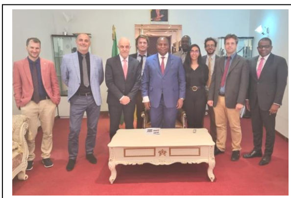
Avec le Président de la République

Le site France-Asie ayant disparu définitivement, les adhésions à France-Asie peuvent se faire par chèque à l'ordre de France-Asie au 10 rue Ernest Psichari 75007 Paris.