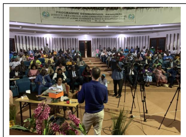
Grande Conférence au CES